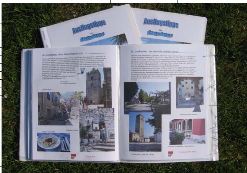
Links: Hum, die kleinste Stadt der Welt - Rechts: Das malerische Städtchen Opatralj