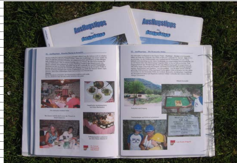
Links: Konoba Marija in Krunčići - Rechts: Die Romualdo Höhle